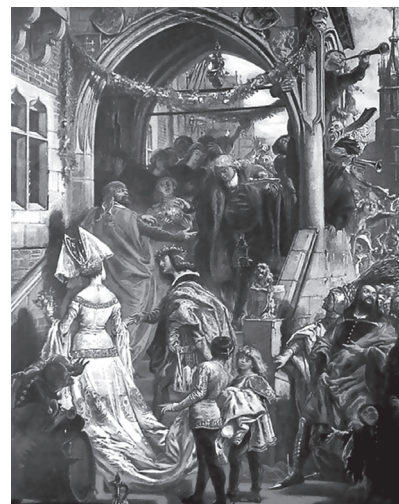
„Uczta u Wierzyńka” Jana Matejki

Zygmunt Luxemburski, który liczył na tron polski potraktował tą decyzję za afront i do końca życia nienawidził