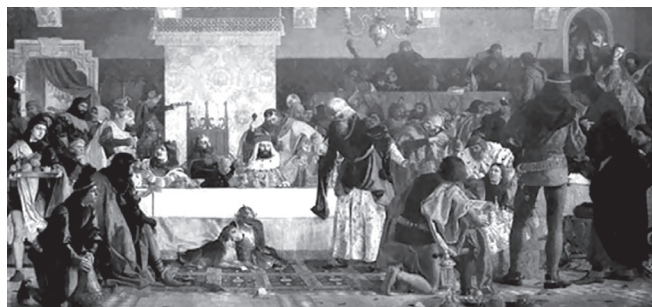
„Uczta u Wierzyńka” Bronisława Abramowicza